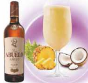
Piña Colada PIÑA, COCO PINEAPPLE, COCONUT & RON CON COCO / RUM WITH COCONUT