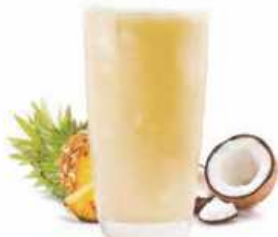
SMOOTHIE PIÑA COLADA Piña y coco Pineapple and coconut