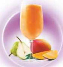
Caipifruta MANGO Y PERA MANGO & PEAR & VODKA

Elaborados con trozos de fruta natural Made with fruit pieces