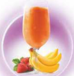
Mediterranean Party PLÁTANO, FRESA BANANA, STRAWBERRY & COINTREAU