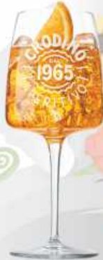
CRODINO (Sin alcohol)