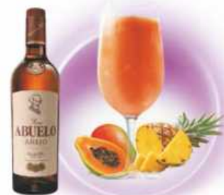
Canarian Sunset PIÑA, PAPAYA, MANGO PINEAPPLE, PAPAYA, MANGO & RON / RUM