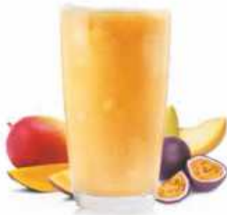
SMOOTHIE TRIPLE M Mango, melón y maracuyá Mango, melon and passion fruit