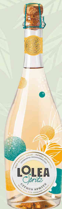
Lolea Spritz Citrus 0,75L