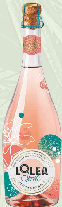
Lolea Spritz Floral 0,75L