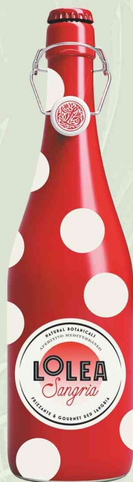
Lolea Tinta Frizzante 0,75L