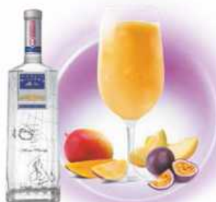
Summer Romance MANGO, MELÓN Y MARACUYÁ MANGO, MELON AND PASSION FRUIT & GINEBRA / GIN