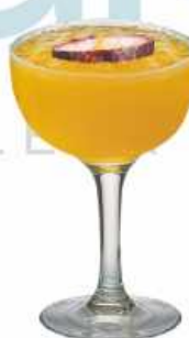
Fruta de la Pasión