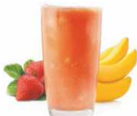
SMOOTHIE RED BANANA Fresa y plátano Strawberry and banana