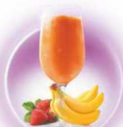
Mediterranean Party PLÁTANO, FRESA BANANA, STRAWBERRY & COINTREAU