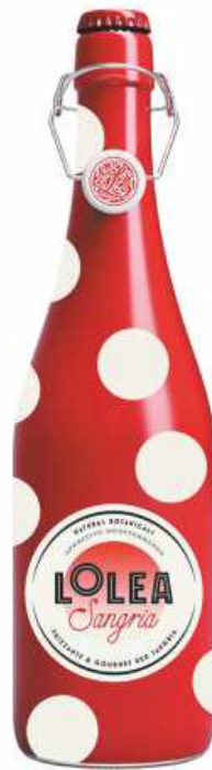
Lolea Sangría Frizzante 0,75L