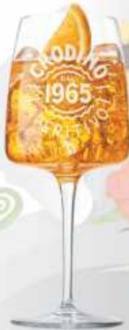
CRODINO (Sin alcohol)