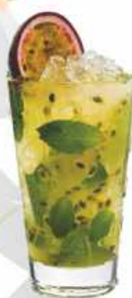
Fruta de la Pasión