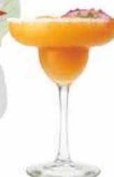
Fruta de la Pasión