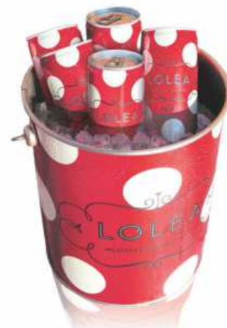
Lolea 5 latas de 0,25L