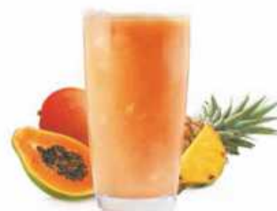
SMOOTHIE TROPIC MIX Piña, papaya y mango Pineapple, papaya and mango