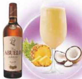
Piña Colada PIÑA, COCO PINEAPPLE, COCONUT & RON CON COCO / RUM WITH COCONUT