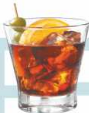
CINZANO ROSA & BIANCO