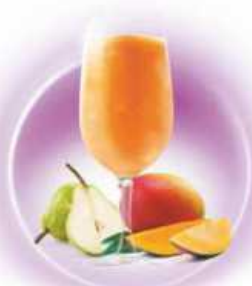
Caipifruta MANGO Y PERA MANGO & PEAR & VODKA

Elaborados con trozos de fruta natural Made with fruit pieces