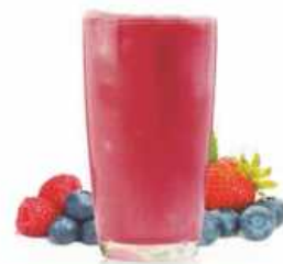
SMOOTHIE BERRY DREAM Fresa, frambuesa y arándanos Strawberry, raspberry and blueberry

Elaborados con trozos de fruta natural Made with fruit pieces