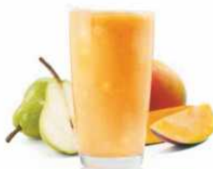
SMOOTHIE MANGO FRESH Mango y pera Mango and pear