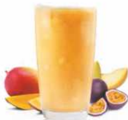
SMOOTHIE TRIPLE M Mango, melón y maracuyá Mango, melon and passion fruit