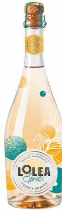
Lolea Spritz Citrus 0,75L