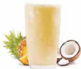
SMOOTHIE PIÑA COLADA Piña y coco Pineapple and coconut