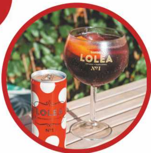
Lolea lata de 0,25L