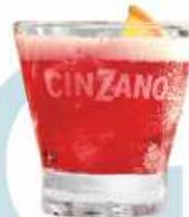
CINZANO BITTER SODA