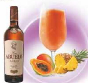
Canarian Sunset PIÑA, PAPAYA, MANGO PINEAPPLE, PAPAYA, MANGO & RON / RUM