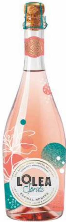
Lolea Spritz Floral 0,75L