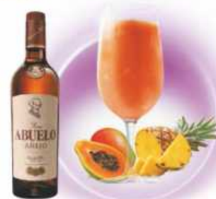
Canarian Sunset PIÑA, PAPAYA, MANGO PINEAPPLE, PAPAYA, MANGO & RON / RUM