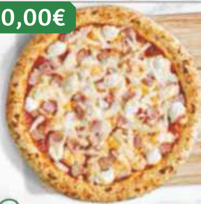
Prosciutto e formaggio

Tomate italiano, queso mozzarella, jamón cocido y extra de queso crema.