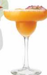
Fruta de la Pasión