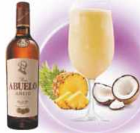
Piña Colada PIÑA, COCO PINEAPPLE, COCONUT & RON CON COCO / RUM WITH COCONUT